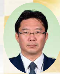
奈良県警察本部長 宮西 健至