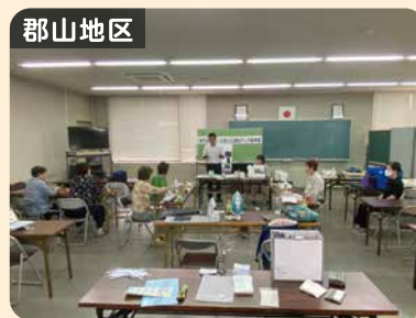
郡山地区 防犯啓発物品製作活動