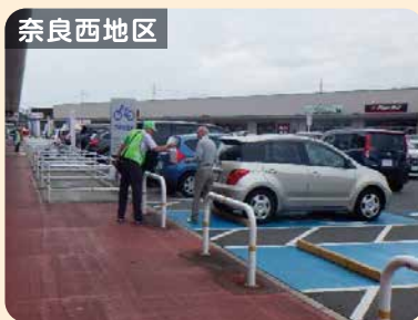
奈良西地区 特殊詐欺被害防止等啓発活動