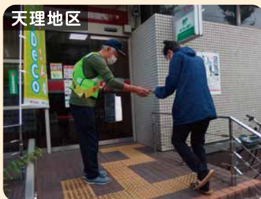
天理地区 特殊詐欺被害防止啓発活動