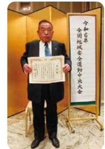
防犯功労 ボランティア団体様