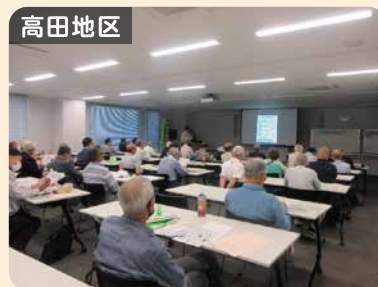
高田地区 特殊詐欺被害防止研修会