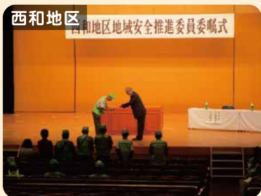
西和地区 地域安全推進委員委嘱式