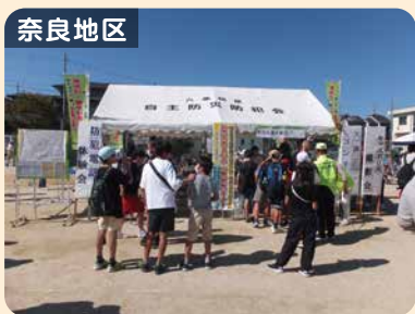
奈良地区 特殊詐欺被害防止等啓発活動