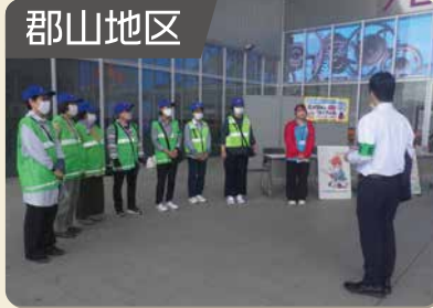
自転車盗難防止啓発活動