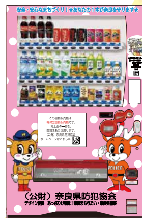
犯罪・非行防止支援自動販売機