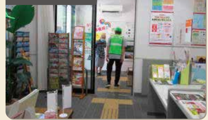
特殊詐欺被害防止啓発活動