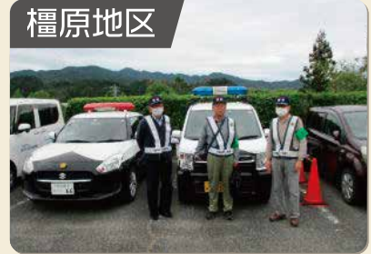
防犯パトロール活動