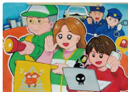
令和6年 全国最優秀ポスター (様々なかたちの防犯ボランティア活動)

地域安全に資する関係機関・団体及び警察が、期間を定め、地域安全活動を更に強化するとともに、その相互の連携を一層緊密にすることにより、地域安全活動の効果を最大限に上げて一層の浸透と定着を図り、もって安心して暮らせる地域社会の実現を図ります。