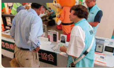
特殊詐欺被害防止等啓発活動