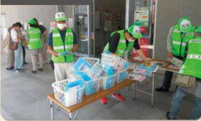
自転車盗難防止啓発活動