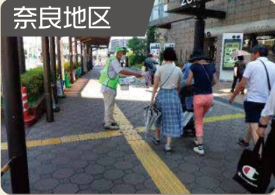
特殊詐欺被害防止啓発活動