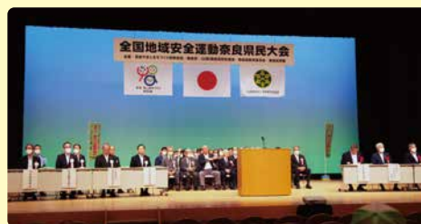
令和5年度の開催状況