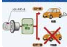
イモビライザの仕組み(メーカー保証あり)

イモビライザはエンジンキーから発信される複雑な暗号 (IDコード) を車両本体のコンピュータで照合し、IDが一致しないとエンジンが掛からない盗難防止装置です。