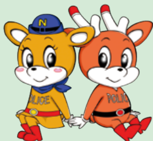
奈良県警察 マスコットキャラクター ナピちゃん、ナポくん