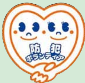
(公財)全国防犯協会連合会 防犯ボランティアシンボルマーク