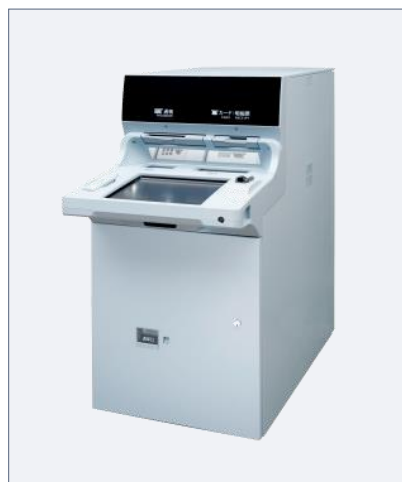
現金自動取引装置 (AKe-S)

・記載の会社名、製品名は、それぞれの会社の商標もしくは登録商標です。 ・記載の仕様は、製品の改良などのため予告なく変更することがあります。 ・本製品を輸出される場合には、外国為替及び外国貿易法の規制ならびに米国の輸出管理規則など外国の輸出関連法規をご確認のうえ、必要な手続きをお取りください。なお、ご不明な場合は、弊社担当営業にお問い合わせください。