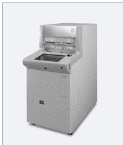
現金自動取引装置 (AK-1)

本ソリューションの適用対象ATMは、以下の2機種となります。 両機種ともに、日立オムロンターミナルソリューションズ株式会社の開発製品です。